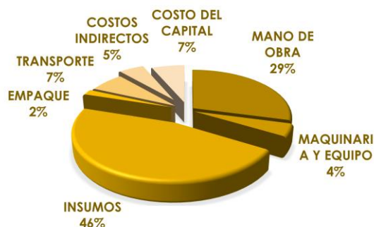
Gráfica 2. Desagregación de Costos de producción (Ha) Diacol Capiro- 2018 Antioquia